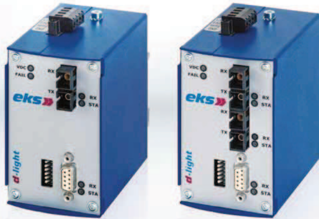
DL485 / DL485-4W